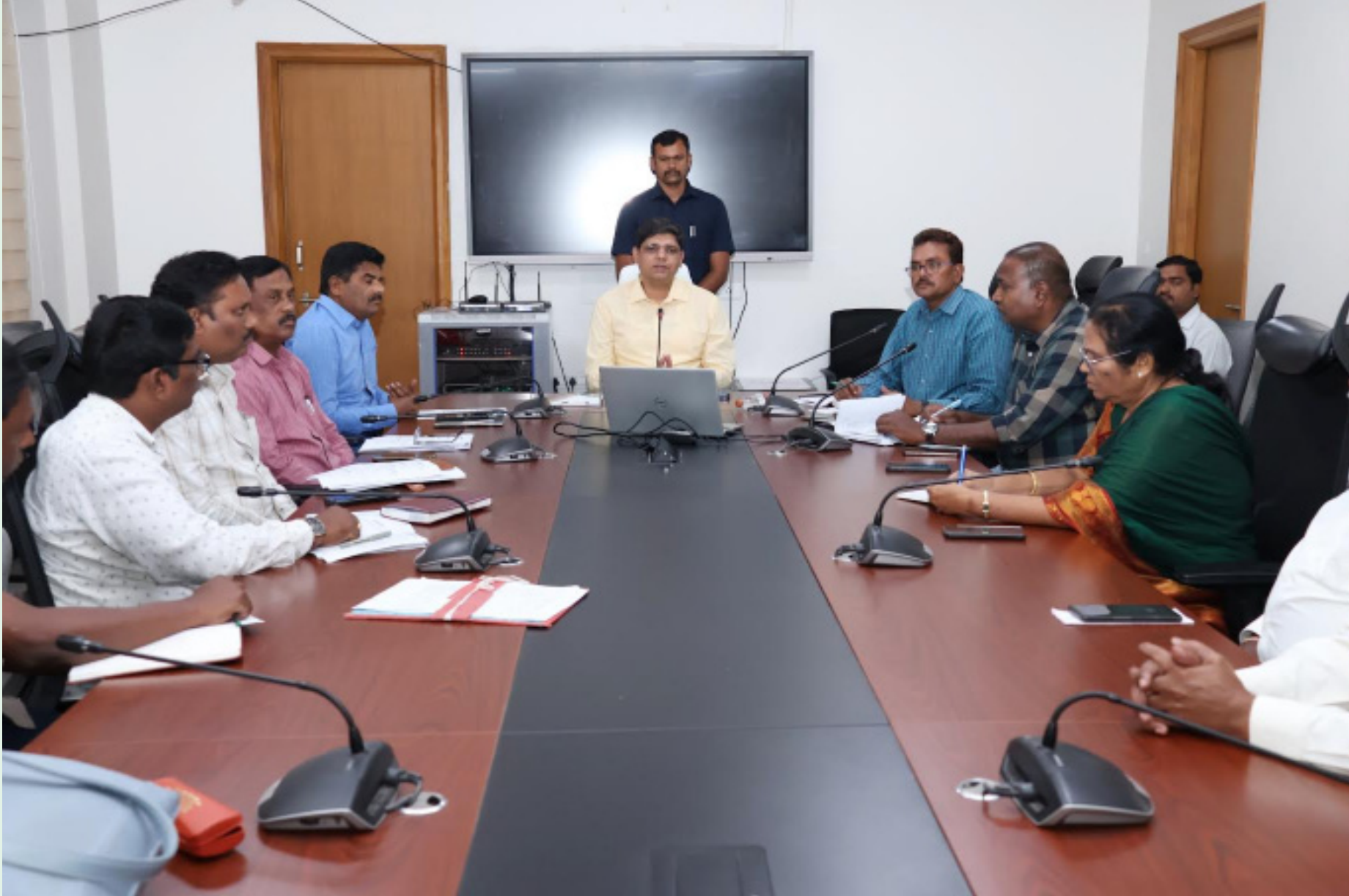
ఎర్పాటు చేస్తున్నట్లు ఆయన వెల్లడించారు.

ప్రభుత్వ ప్రధాన కార్యదర్శి ఆధ్వర్యంలో హైలెవల్ కమిటీ