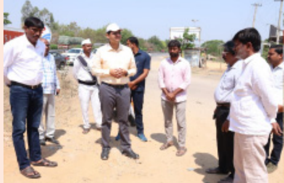
అవసరమైన చర్యలు తీసుకోవాలని సూచించారు.

కామారెడ్డి జిల్లా (భారత శక్తి ప్రతినిధి) మార్చి 13: ప్రజాపాలన ప్రగతి ప్రణాళికలో భాగంగా శుక్రవారం అడ్డూర్-ఎల్లారెడ్డి గ్రామపంచాయతీ పరిధిలో గ్రామ అధికారుల ద్వారా అడ్డూర్ శివారులో నిర్వహిస్తున్న ప్లాస్టిక్ సేకరణ కార్యక్రమాన్ని జిల్లా కలెక్టర్ ఆశిష్ సాంగ్వాన్ తనిఖీ చేసి తగు సూచనలు జారీ చేశారు.